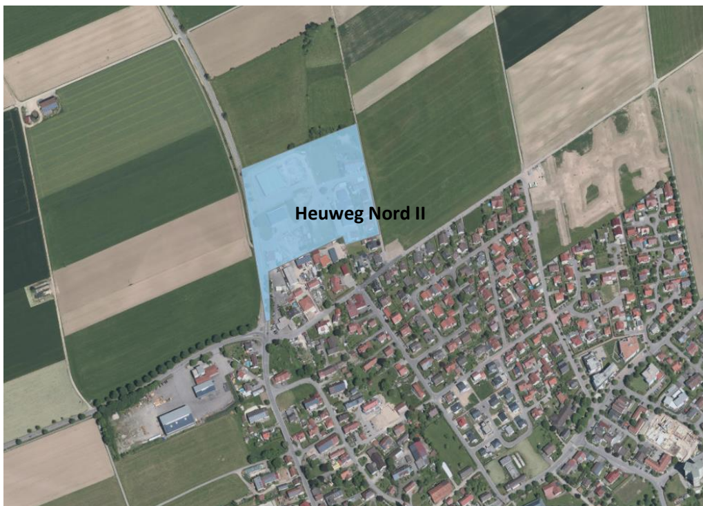
Abb. 1: Lage des Gewerbegebietes „Heuweg Nord II“ (nicht maßstäblich)

Das Gewerbegebiet „Heuweg Nord II“ liegt in exponierter Lage am nordwestlichen Ortsausgang der Gemeinde Kirchdorf an der Iller zwischen Dettinger Straße und Heuweg. Das Plangebiet des Bebauungsplanes „Heuweg Nord II“ umfasst eine Fläche von ca. 3,52 ha und schließt im südlichen Bereich unmittelbar an bestehende Wohnbebauung an. Nördlich, westlich und östlich des Plangebietes befinden sich landwirtschaftliche Flächen (vgl. Abbildung 1).