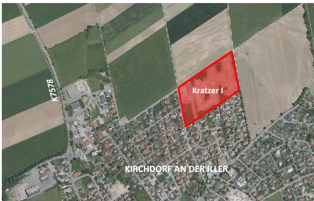
Abbildung 1: Lage des allgemeinen Wohngebiets „Kratzer I“ (nicht maßstäblich)

Das Wohngebiet „Kratzer I“ (WA) liegt am nordöstlichen Rand der Gemeinde Kirchdorf an der Iller, welches den unmittelbaren Wohnbedarf im Gemeindegebiet abdecken soll. Das Plangebiet des Bebauungsplans „Kratzer I“ umfasst eine Fläche von ca. 3,7 ha und schließt unmittelbar im Süden und Westen an bestehende Wohngebiete an. Im Norden und Osten vom Plangebiet „Kratzer I“ liegt landwirtschaftlich genutzte Fläche. Der im Rahmen der gegenständlichen Planung neu entstehende nordöstliche Ortsrand wird voraussichtlich längerfristig der Abschluss des Siedlungskörpers der Gemeinde Kirchdorf an der Iller im Nordosten darstellen. Aufgrund der Nähe zur Dettinger Straße (K7578) und seiner Randlage hat das Plangebiet große Wirkungskraft für die Wahrnehmung des Ortsrandes für den einfahrenden Verkehr und ist damit im Norden ortsbildprägend.